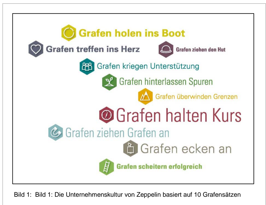
Bild 1: Die Unternehmenskultur von Zeppelin basiert auf 10 Grafensätzen

Kundenorientierung, Innovation und Verantwortung finden wir in vielen Unternehmensleitbildern. Die "Grafensätze" beinhalten jedoch eine individuelle Authentizität und Einzigartigkeit für die Unternehmenskultur. Der Graf war zu seiner Zeit Visionär, Teamworker, Innovator und Magnet für Talente. Er setzte